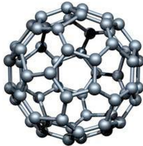
Molécule de Fullerène C 60

Par ailleurs, des Fullerènes en C 60 se sont révélés génotoxiques dans le test Comet sur des lymphocytes humains et ceci à de très faibles concentrations (2,2µg/L -1 ).